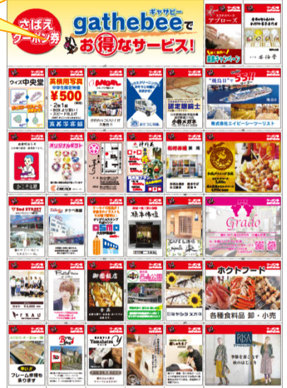
昨年のチラシ(新聞折込済)