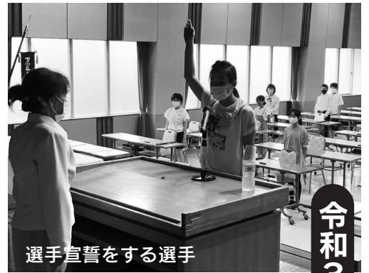
選手宣誓をする選手