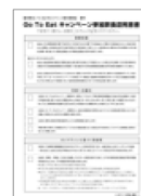
①「利用店登録申請書」 ②「参加飲食店同意書」