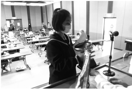
そろばん鯖江一の表彰の様子