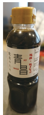
青昌特製 焼肉のタレ